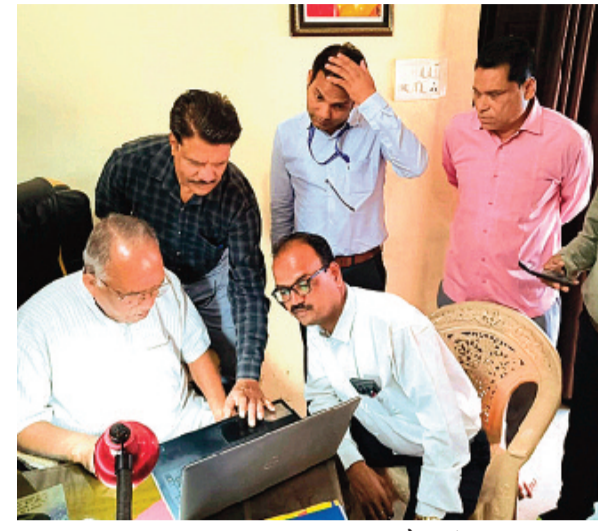
हरिभूमि न्यूज ▶▶ राजगढ़

आमजन घर बैठे अपने मोबाइल से कर सकते हैं स्व-गणना